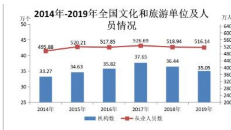
表 3：2014年-2019年全国文化单位机构数及从业人员数

作为文化大省，广东文化产业增加值连年位居全国第一，约占全国文化产业总量的七分之一。据统计部门核定，2018年全省文化产业增加值达5787.81亿元，占GDP比重5.79%，同比2013年增长了1.9倍。